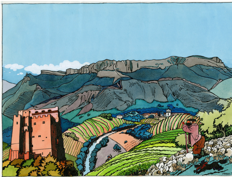
F'murr, Vallée de la Drôme , 1993 Musée Tomi Ungerer - Centre international de l'illustration, dépôt de la Bibliothèque nationale de France © succession F'murr

Une invitation a été faite à Camille Potte, illustratrice contemporaine inspirée par l'univers médiéval de F'murr, pour accompagner l'exposition.