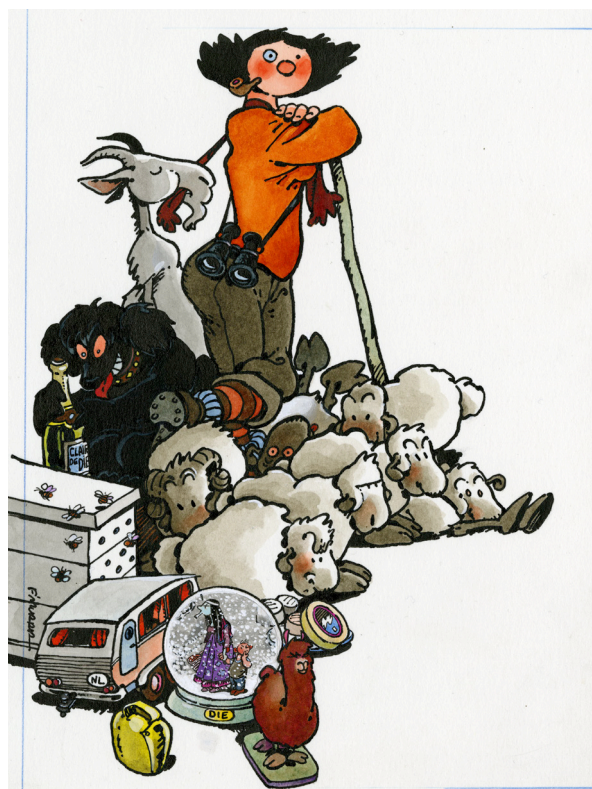
F'murrr, projet d'affiche pour la fête de la Transhumance de Die 1994, s.d. Musée Tomi Ungerer - Centre international de l'illustration, dépôt de la Bibliothèque nationale de France © succession F'murrr

L'exposition montre comment F'murrr a réalisé sa première histoire longue pour À suivre ( Jehanne et Tim Galère ) et comment ses illustrations ont été influencées par l'univers pastoral. Ses dessins de presse des années 1980 sont également abordés ainsi que son intérêt pour l'Histoire avec Notre Histoire et Mélusine et la représentation des femmes, qu'il poursuit avec Deux Mille Meuf , portraits pleins de tendresse pour les femmes de tout âge et de tous styles.