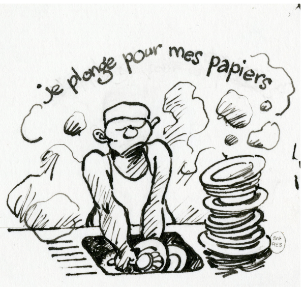
F'murr, dessin pour le livre Sans-papiers ? - pour lutter contre les idées reçues , 2010 Musée Tomi Ungerer - Centre international de l'illustration, dépôt de la Bibliothèque nationale de France © succession F'murr

Pour la toute première fois en 2022, une dation de dessins d'illustration est acceptée par l'État français et l'œuvre de F'murr (Richard Peyzaret, dit, 1946-2018) est répartie en dépôt entre la Cité internationale de la bande dessinée et de l'image d'Angoulême et le Musée Tomi Ungerer - Centre international de l'illustration.