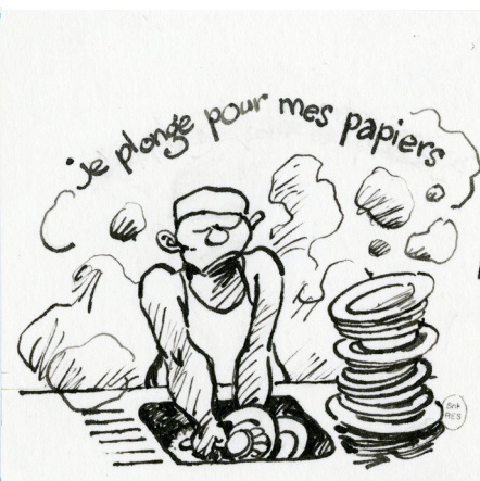
F'murrr, dessin pour le livre Sans-papiers ? - pour lutter contre les idées reçues , 2010

Pour la toute première fois en 2022, une dation de dessins d'illustration est acceptée par l'État français et l'œuvre de F'murrr (Richard Peyzaret, dit, 1946-2018) est répartie en dépôt entre la Cité internationale de la bande dessinée et de l'image d'Angoulême et le Musée Tomi Ungerer – Centre international de l'illustration.