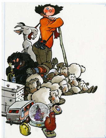
F'murrr, projet d'affiche pour la fête de la Transhumance de Die 1994, s.d.

Une invitation a été faite à Camille Potte, illustratrice contemporaine inspirée par l'univers médiéval de F'murrr, pour accompagner l'exposition.