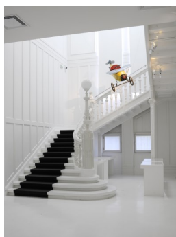
3. Vue intérieure : l'escalier original de la Villa Greiner, fin du XIX e siècle. Musée Tomi Ungerer - Centre international de l'illustration.