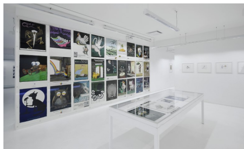
5. Une vue de l'exposition « Les affiches de Tomi Ungerer ». Musée Tomi Ungerer - Centre international de l'illustration.