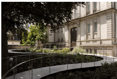
1. L'entrée du musée avec la passerelle d'accès. Musée Tomi Ungerer - Centre international de l'illustration.

Demande à adresser à : Service communication des Musées de la Ville de Strasbourg Julie Barth 2 place du Château, Strasbourg Julie.barth@strasbourg.eu Tél. + 33 (0)3 68 98 74 78