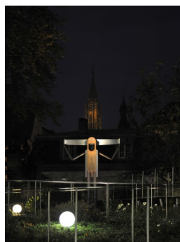
8. « Sur les dents », sculpture d'après un dessin de Tomi Ungerer, réalisée par les ateliers des Musées de la Ville de Strasbourg en 2011. Musée Tomi Ungerer - Centre international de l'illustration.