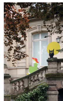
9. D'après le livre Les Trois Brigands , réalisé par les ateliers des Musées de la Ville de Strasbourg en 2016. Musée Tomi Ungerer - Centre international de l'illustration.