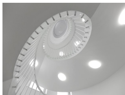
6. Vue de l'escalier de secours, construit pour l'ouverture du musée en 2007 par Emmanuel Combarel. Musée Tomi Ungerer - Centre international de l'illustration.