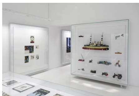
2. Au rez-de-chaussée du musée, des jouets mécaniques de la collection Tomi Ungerer. Musée Tomi Ungerer - Centre international de l'illustration.