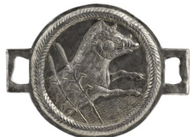
5. et 6. Paire de phalères décorées. Époque mérovingienne. Ittenheim. Musée Archéologique.