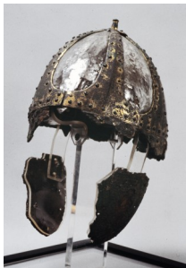
1. Musée Archéologique.