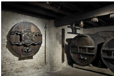
5. Le pressoir à vin installé dans la cave du Musée Alsacien.