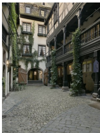
2. Vue des trois immeubles abritant le Musée Alsacien.