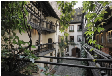
3. La grande cour du Musée Alsacien.