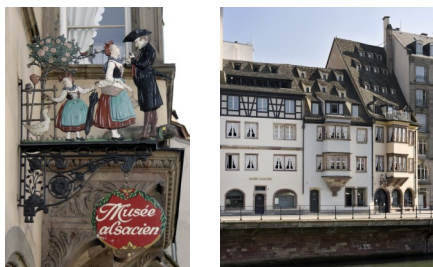
1. Enseigne du Musée Alsacien dessinée par l'artiste Paul Braunagel en 1906.

Demande à adresser à : Service communication des Musées de la Ville de Strasbourg Julie Barth 2 place du Château, Strasbourg Julie.barth@strasbourg.eu Tél. + 33 (0)3 68 98 74 78