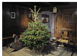
11. La Stüb de Wintzenheim – Kochersberg, aménagée au Musée Alsacien vers 1911