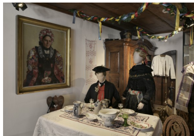
8. Stub d'Ammerschwihr reconstituée au Musée Alsacien en 1907.