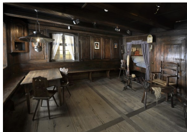
10. La Stüb de Wintzenheim – Kochersberg, aménagée au Musée Alsacien vers 1911