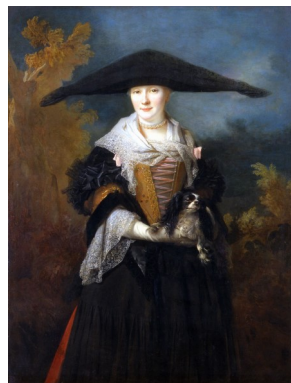
5. Nicolas de Largillière (Paris, 1656 - Paris, 1746), La Belle Strasbourgeoise , 1703. Huile sur toile, 138 x 106 cm. Musée des Beaux-Arts.