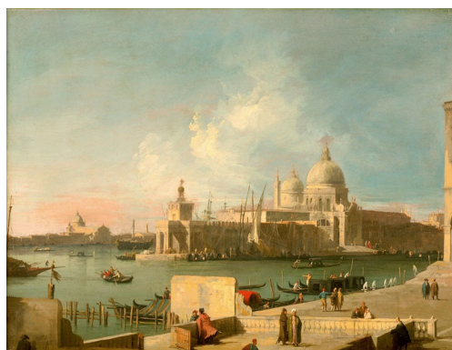
6. Giovanni Antonio Canal, dit Canaletto (Venise, 1697 - Venise, 1768), Vue de l'église de la Salute depuis l'entrée du Grand Canal , vers 1727. Huile sur cuivre, 45 x 60 cm. Musée des Beaux-Arts.