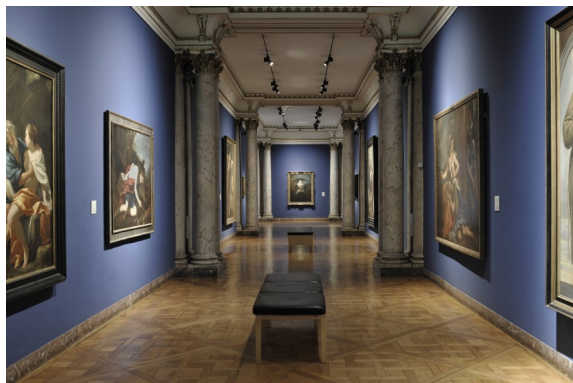
1. Musée des Beaux-Arts, salle des colonnes.

Demande à adresser à : Service communication des Musées de la Ville de Strasbourg Julie Barth 2 place du Château, Strasbourg Julie.barth@strasbourg.eu Tél. + 33 (0)3 68 98 74 78