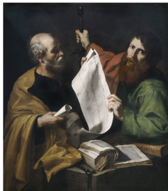
3. Jusepe de Ribera (Jativa, 1591 - Naples, 1652), Saint Pierre et Saint Paul , vers 1616. Huile sur toile, 126 x 112 cm. Musée des Beaux-Arts.