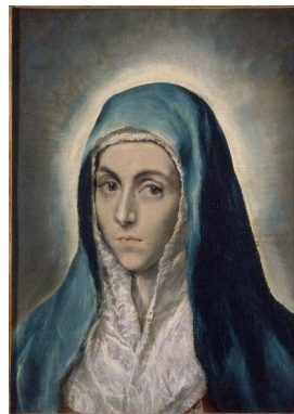
7. Domenicos Theotocopoulos, dit El Greco (Candie (Crète), 1541 - Tolède 1614), Mater Dolorosa, vers 1590-1600. Huile sur toile, 53 x 37 cm. Musée des Beaux-Arts.