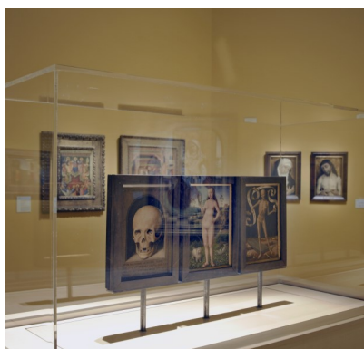
2. Musée des Beaux-Arts, salle 1, Memling.