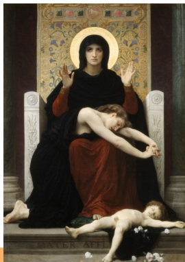
4. William Bouguereau (La Rochelle, 1825 - idem, 1905), La Vierge consolatrice (1877). Huile sur toile ; H. 204 x L. 148 cm. Dépôt de l'Etat en 1962. Musée des Beaux-Arts.