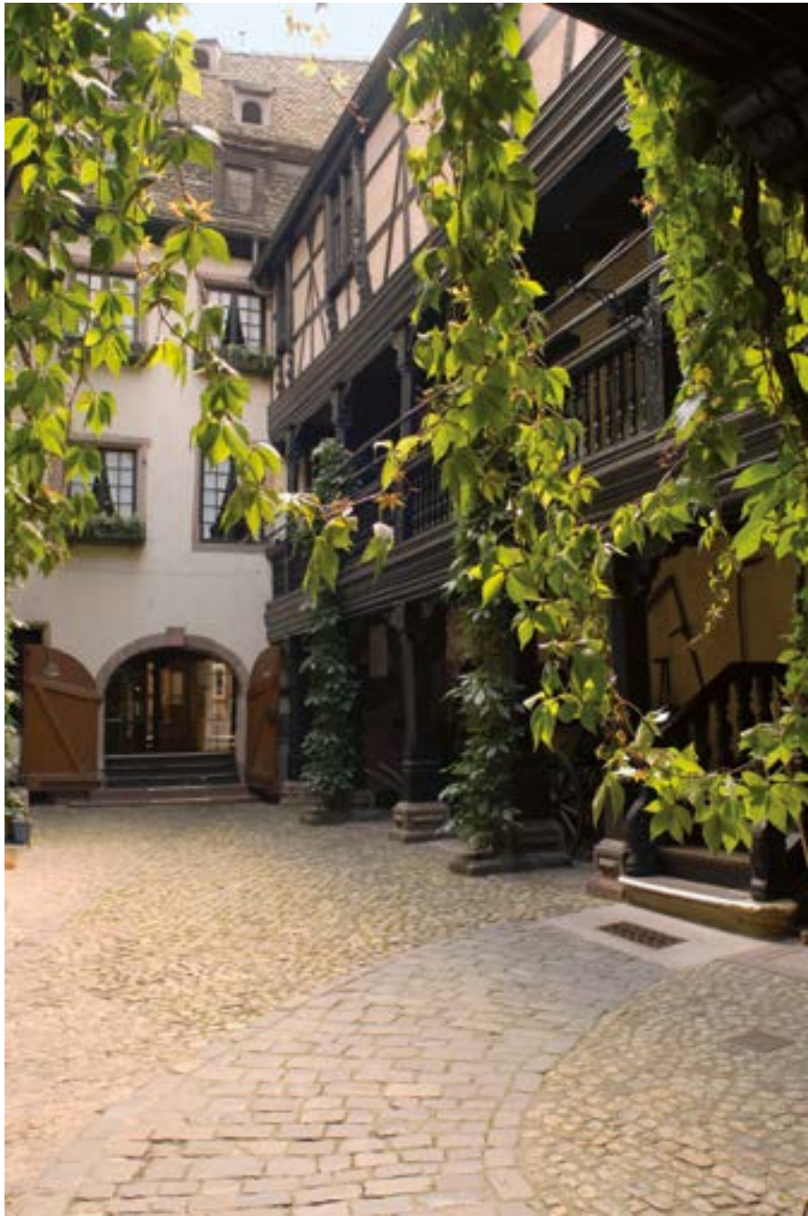
La cour du Musée Alsacien