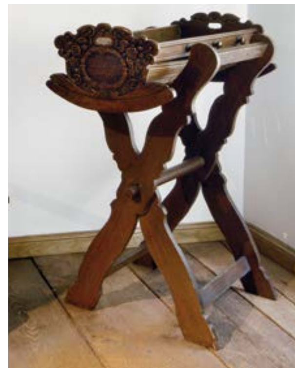
Un ancien berceau

La cigogne est un oiseau migrateur, c'est-à-dire qui change de pays selon les saisons.