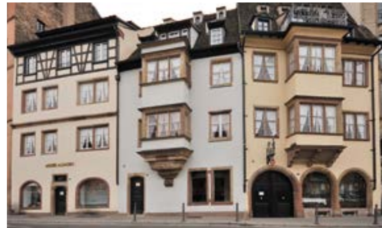
Le Musée Alsacien