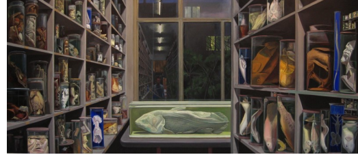
6. Stéphane Belzère, La Salle des pièces molles-nocturne , 2000. Peinture vinylique sur toile Collection Frac Ile-de-France. Photo : M. Bertola / Musées de Strasbourg © ADAGP, Paris 2021