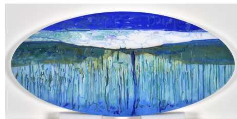
8. Stéphane Belzère, Ovale-paysage n° 11 , 2018. Peinture acrylique sur plexiglas. Courtesy Stéphane Belzère & a-space Gallery Roy Hofer – CH. Photo : M. Bertola / Musées de Strasbourg © ADAGP, Paris 2021