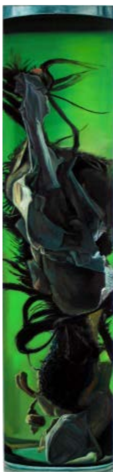
Ovis aries ♂, 1929-107

Les quelque 200 spécimens présentés dans ces « flûtes » de verre offrent une évocation remarquable de la biodiversité parmi les vertébrés et les invertébrés. En effet, les bocaux présentés dans le cadre de l'exposition contiennent des Cnidaires, Batraciens, « poissons » [actinoptérygiens], Mammifères, Serpents, Lézards, Tortues, Crustacés, Insectes, Annélides ou encore des Échinodermes. L'ensemble forme une intrigante « forêt » de cylindres aux reflets changeants, vert et or pour certains, bleu très foncé ou encore rouge sombre. Chaque bocal est identifié et réfère à son « occupant » selon une nomenclature scientifiquement normée que Stéphane Belzère utilise d'ailleurs pour plusieurs de ses œuvres.