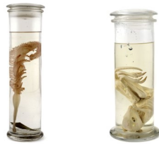
3. Plume de mer, Pennatula phosphorea . Station zoologique Naples 1921. Strasbourg, Musée Zoologique.