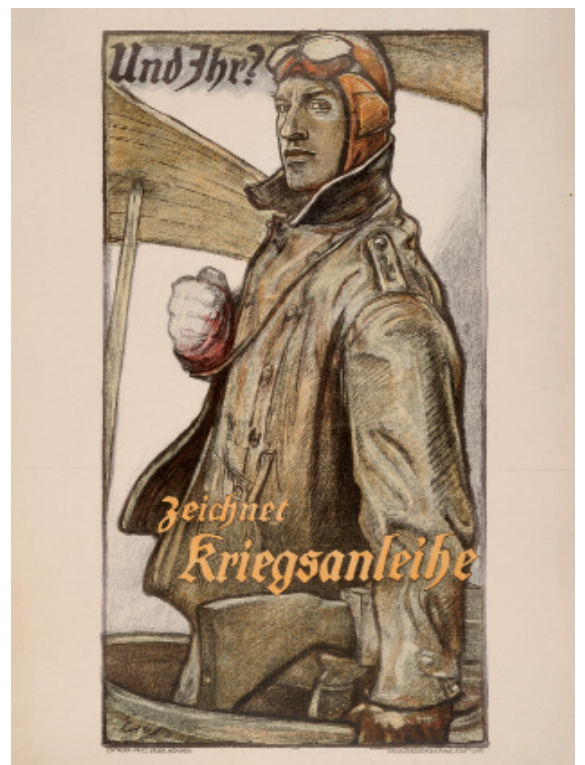
Affiche, Erler Zeichnet Kriegsanleihe