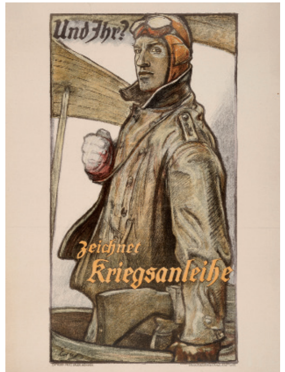
Affiche, Erler Zeichnet Kriegsanleihe