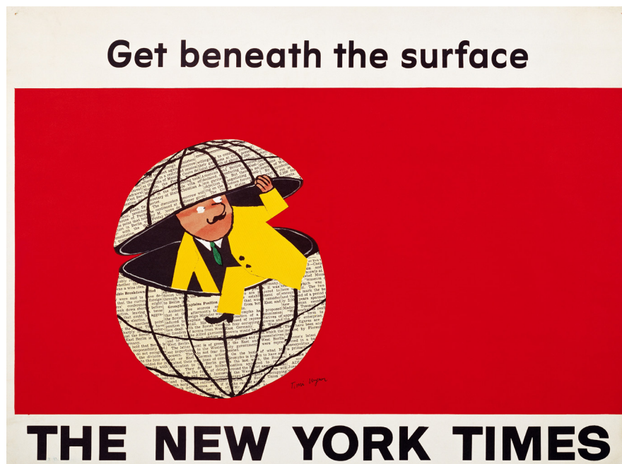
Tomi Ungerer (1931-2019), « Get beneath the surface. The New York Times », campagne pour The New York Times

Différents petits ateliers d'illustration sont proposés au fil du parcours : un petit bout de papier journal devient une image, une image se transforme de façon surréaliste, un support bi-couleur devient objet, et un calque sert à apprendre à sélectionner des éléments sur une image existante et la transformer.