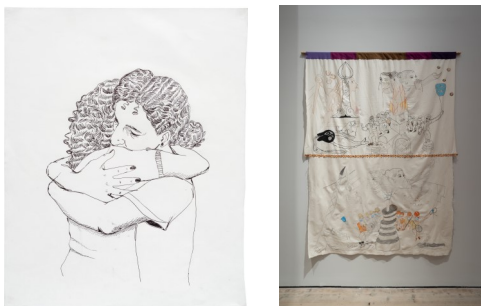
5. Neïla Czermak Icti, sans titre , 2019. Stylo bille bic sur papier, 50 x 40 cm. Courtesy de l'artiste et de la galerie anne barrault. Photo : Aurélien Mole © ADAGP Paris 2025