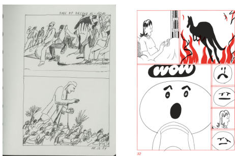
3. Nino Bulling, sans titre , 2024. Encre sur papier, 21 x 16,5 cm.