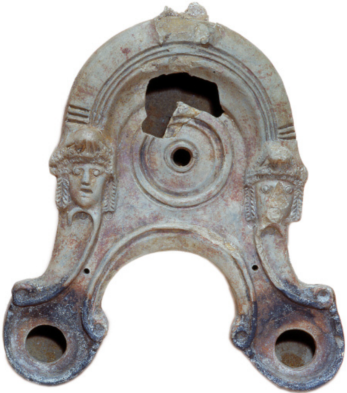
Lampe à huile Céramique I er -III e siècle après J.-C.