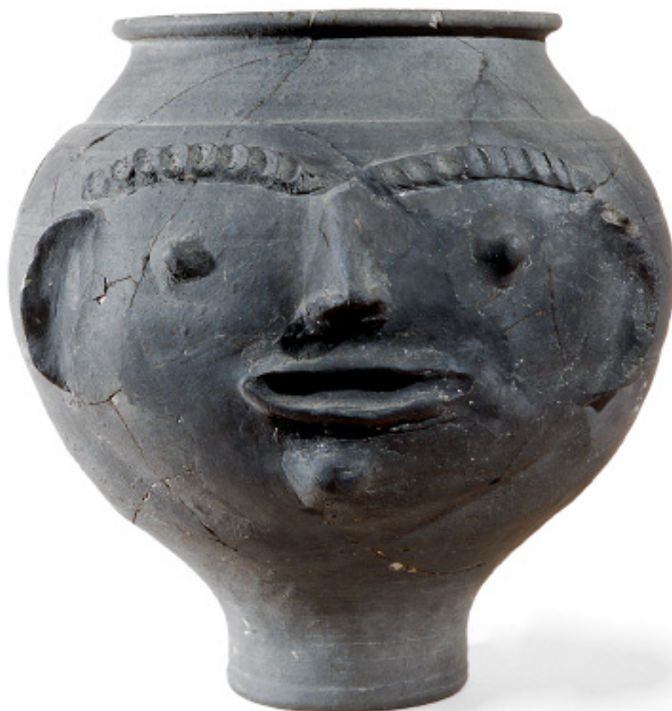
Urne à visage Céramique noire I er siècle après J.-C.

Service éducatif des musées, 2016 www.musees.strasbourg.eu