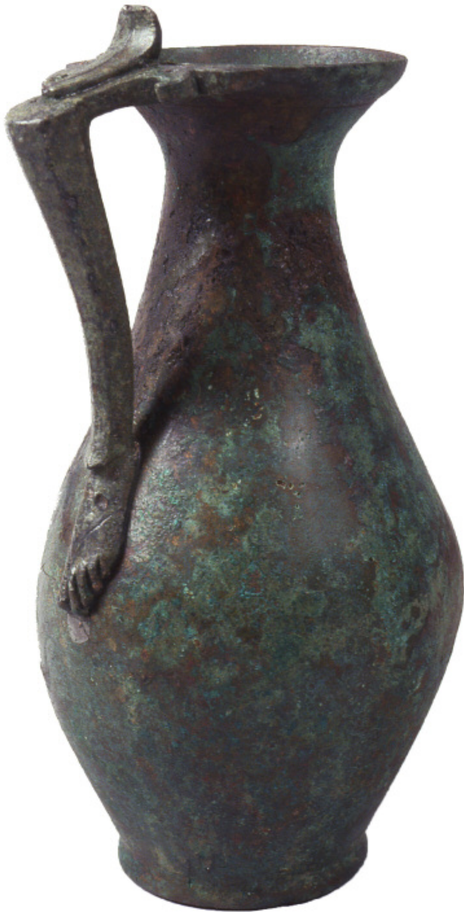
Cruche Strasbourg, 15-17 rue de la Haute-Montée Bronze