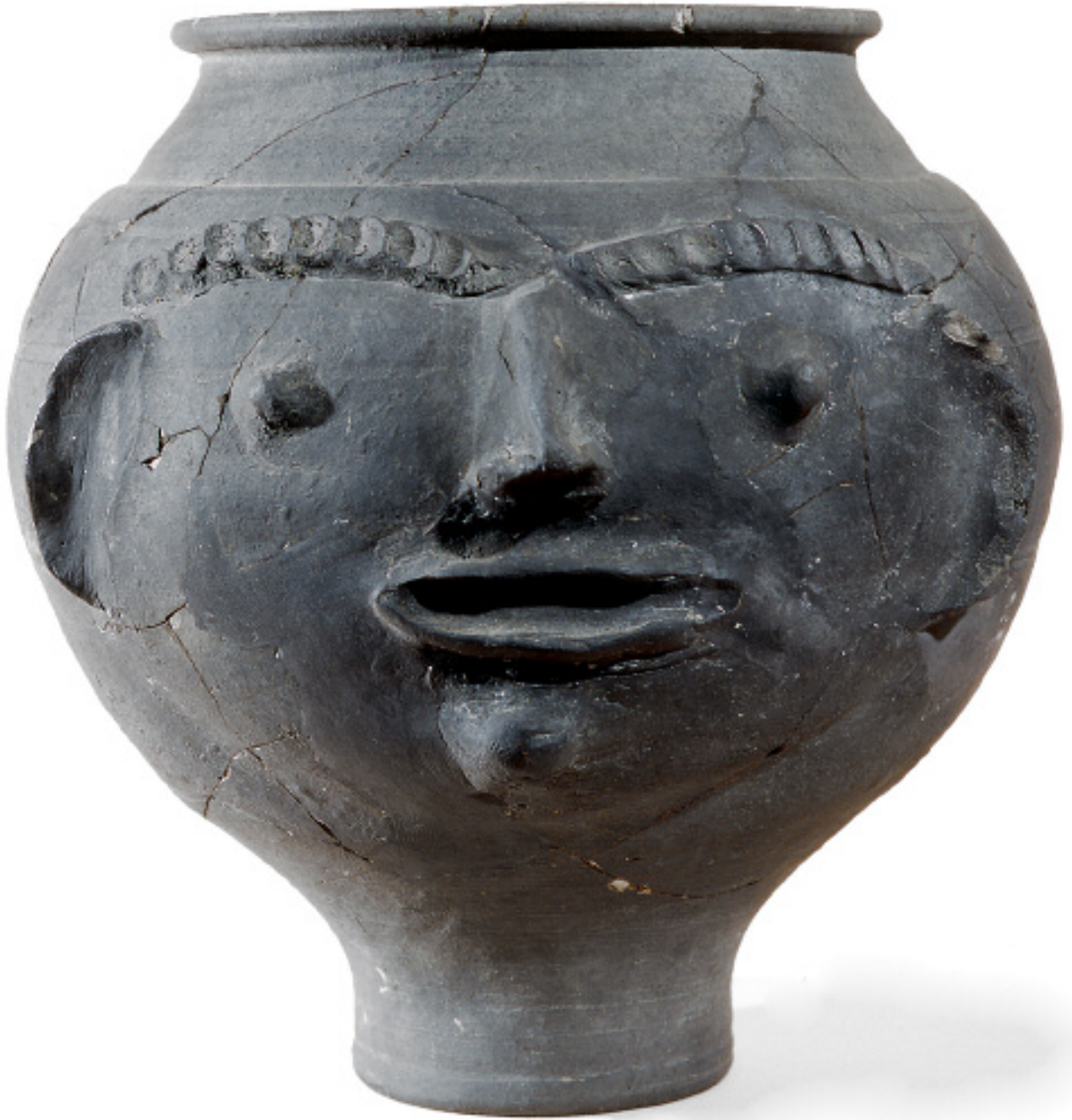
Urne à visage 14, rue de la Nuée Bleue Céramique noire I er siècle après J.-C.