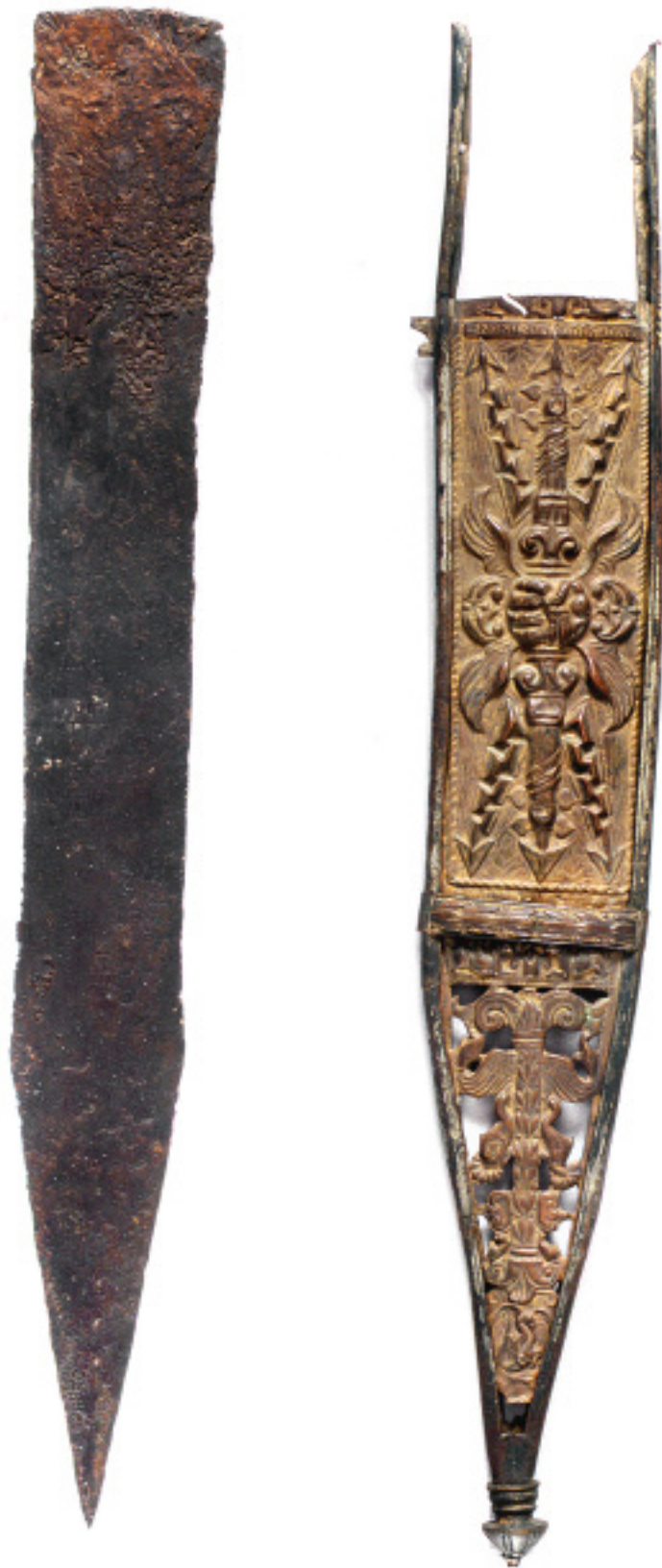
Épée et son fourreau décoré Strasbourg-Koenigshoffen Milieu du 1 er siècle après J.-C.