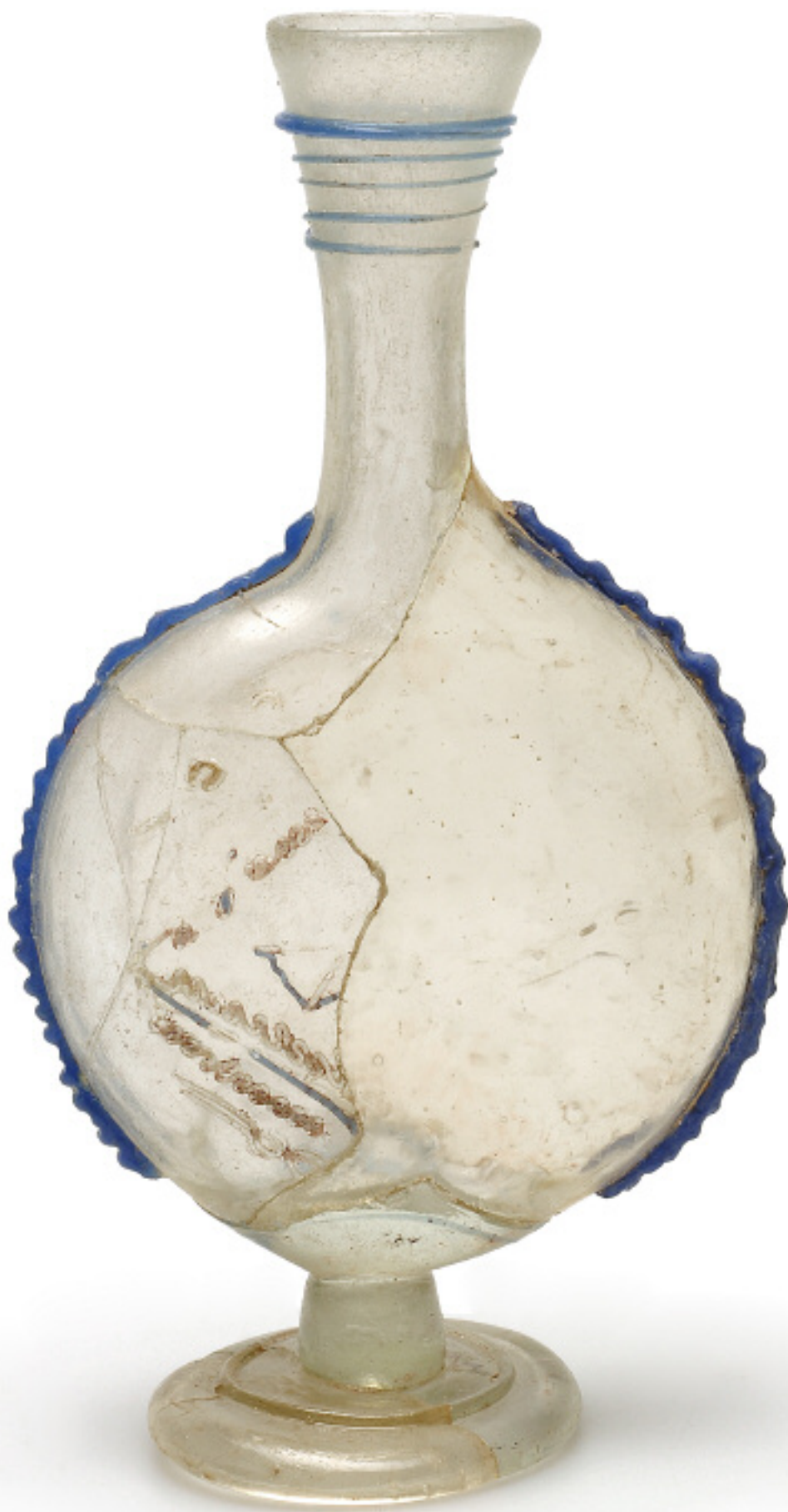
Fiole Strasbourg, Place Sainte-Aurélie Verre Fin III e -début IV e siècle