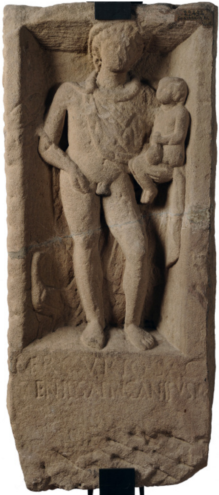
Stèle de Mercure Spachbach-les-Woerth Grès rose III e siècle après J.-C.