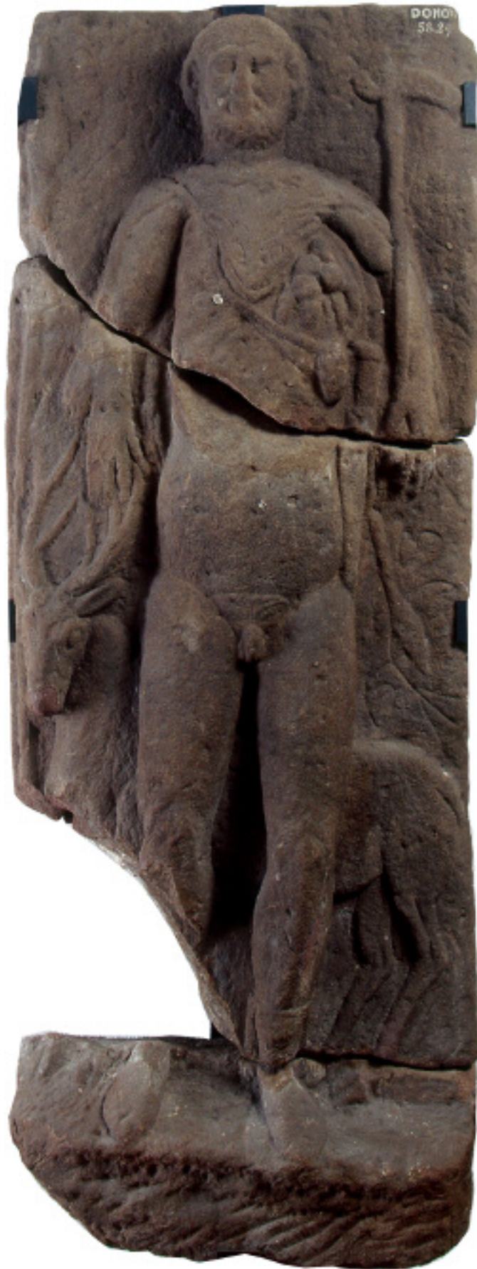
Stèle du dieu au cerf Grandfontaine, sanctuaire du Donon Grès rose III e siècle après J.-C.