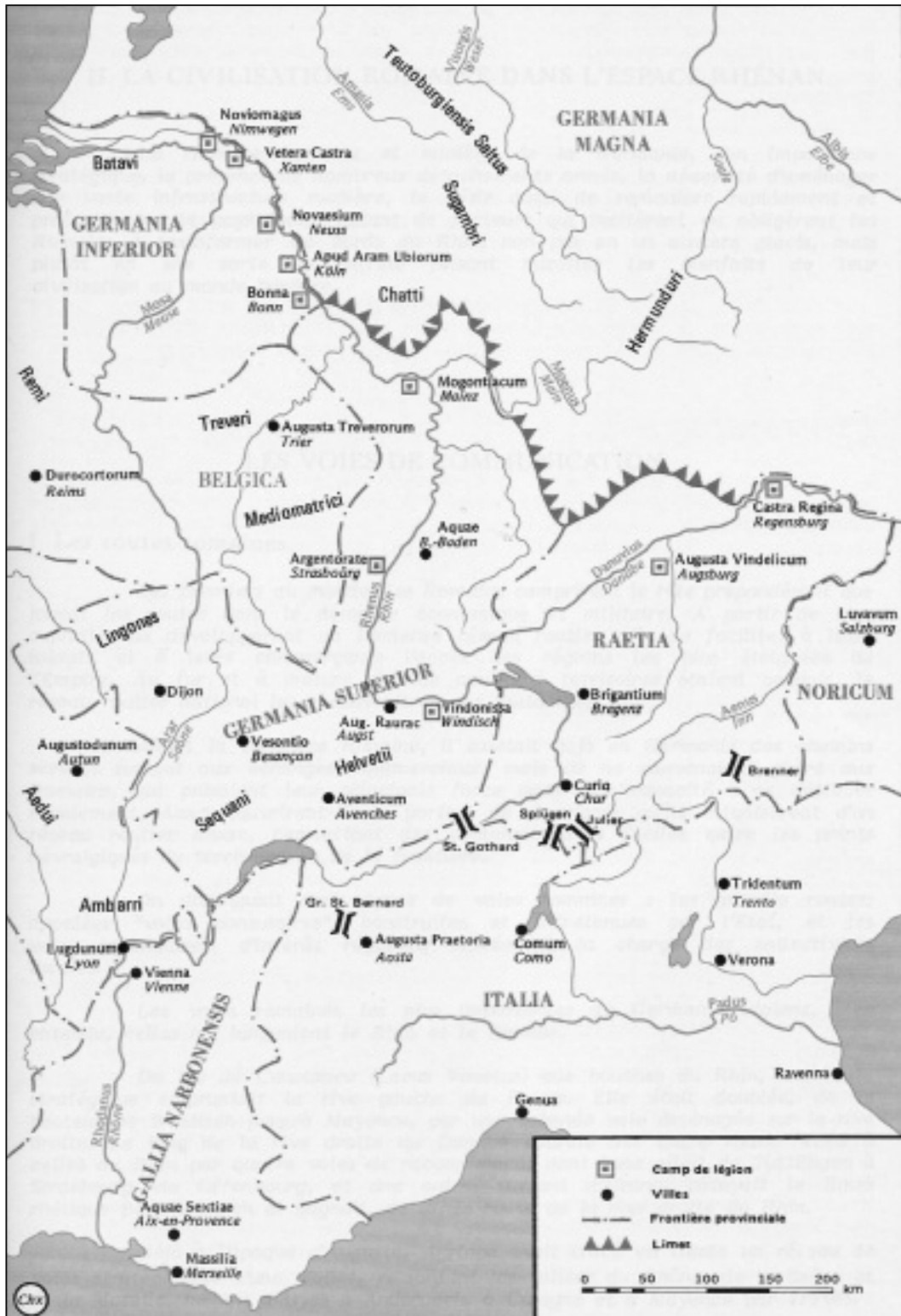
L'espace rhénan au II e siècle après J.-C.

Les Romains dans l'espace rhénan/ d'après document d'André Dubail