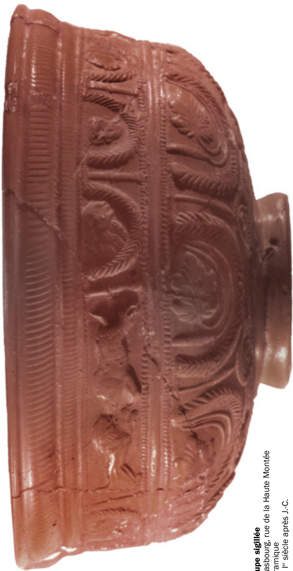
Coupe sigillée Strasbourg, rue de la Haute Montée Céramique Fin 1 er siècle après J.-C.