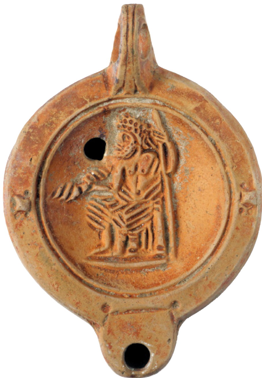
Lampe à huile Céramique I er -III e siècle après J.-C.