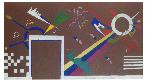
Esquisses pour Le salon de réception Vassily Kandinsky